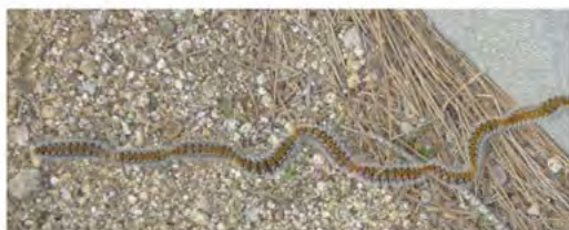
Processons que fan els cucs de processionària en anar a enterrar-se