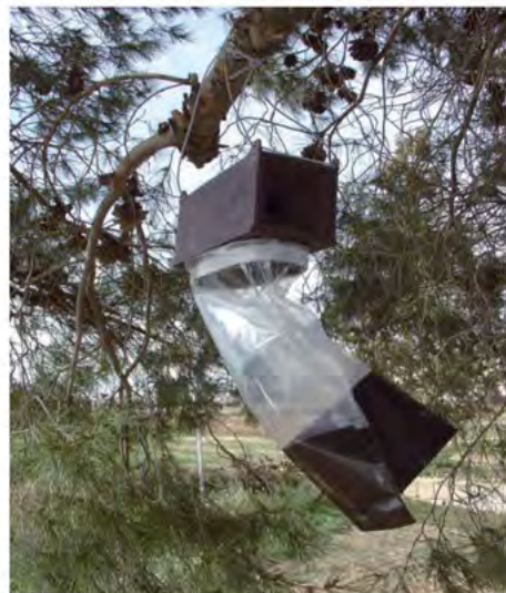
Trampes de processionària on hi ha un dispensador de feromona a l'interior que atrau l'insecte. La forma de la trampa no el deixa sortir