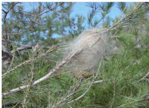
Danys que provoca la processionària del pi en fer les bosses i alimentar-se dels brots joves